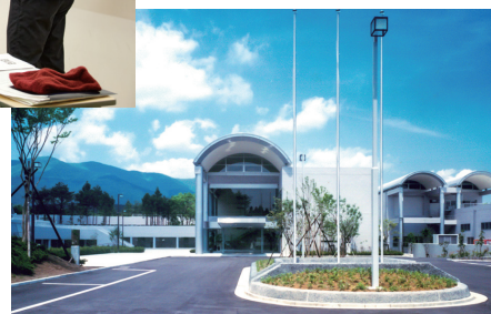
富士山合宿場3号館