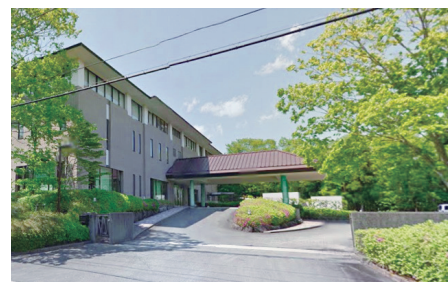
富士山合宿場2号館