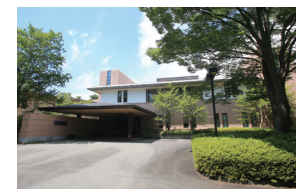
富士山合宿場1号館

英語 英単語・イディオム・重要構文の最終確認とともに、長文に対するアプローチを徹底。